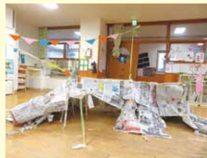
あっぱる保育園 すいか組 「テント」