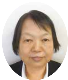
社会福祉法人 千代福祉会 地域福祉担当理事 (あおば園 園長)