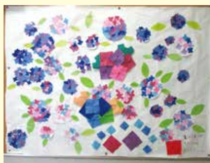
ますみ学園 生活介護 2 班 貼り絵「あじさい」