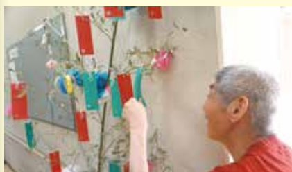
あおば園 生活介護 1・2 班 「七夕飾り」