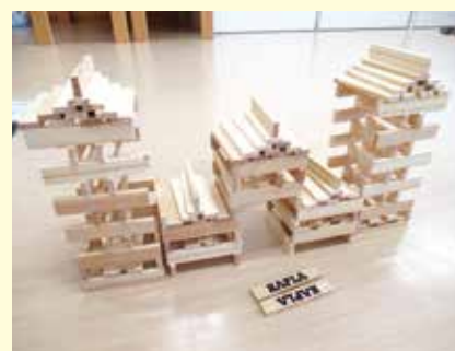
あっぱる愛子保育園 すいか組 積み木「家」