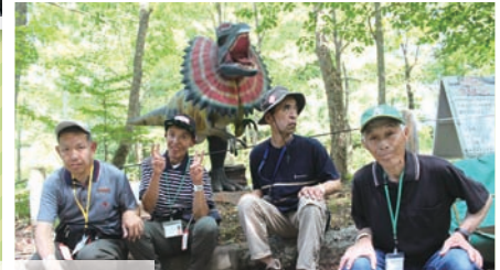
9月5日(木)～9月6日(金) 1泊旅行 栃木方面