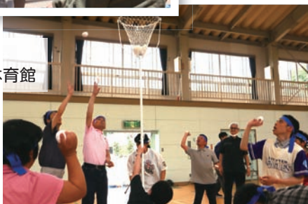
6月21日(金) 運動会 清風園体育館