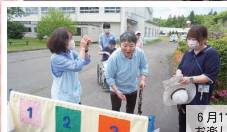
6月11日(火) お楽しみ会 あおば園内