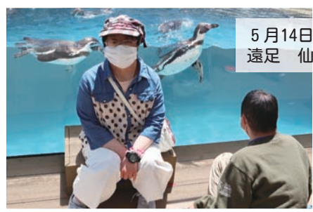
5月14日(火) 遠足 仙台東の杜水族館