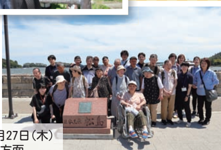
6月20日(木)、6月27日(木) 日帰り旅行 松島方面