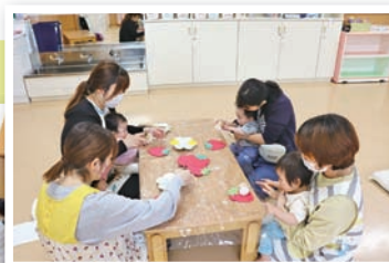
スタンプでいちご作り