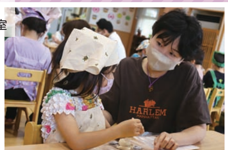
6月21日(金) あっぷるらんど