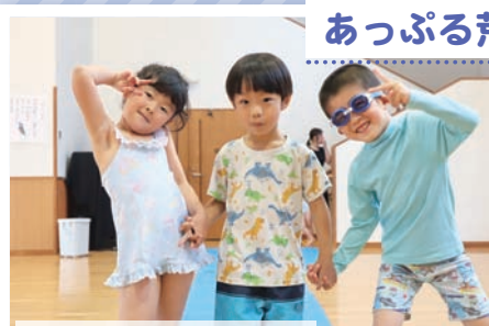
6月19日(水) 水着ファッションショー