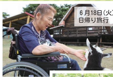
6月18日(火) 日帰り旅行 蔵王ハートランド