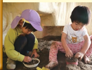
あっぶる荒井こども園