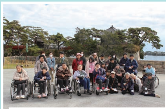
おおぞら学園 日帰り旅行 (11/8・11/15) 松島