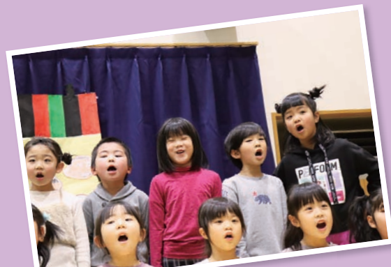
あつぷるフェスタ (12/17)