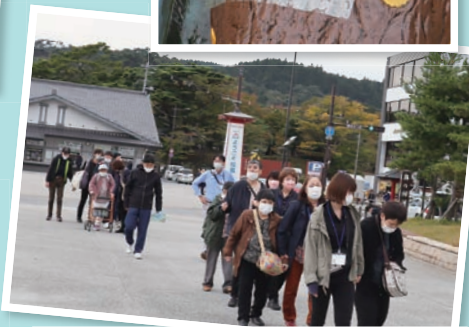
清風園 日帰り旅行 (9/22・10/13) 山形・松島