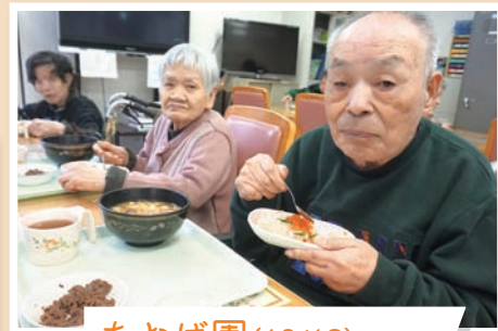
あおば園 (10/13) あおば園内