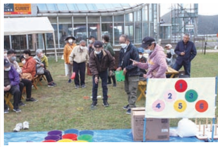
スペースせんだい (10/15) スプリングバレー