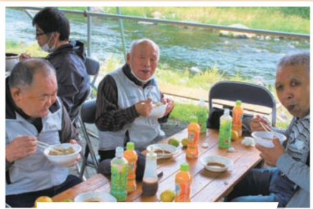
わーぷ (10/12・10/19) ししまる製麺所