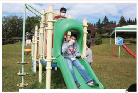
ますみ学園 (10/14) スポーツランドSUGO