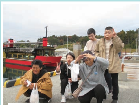
ますみ学園 1泊旅行 (11/1~2) 気仙沼・登米・大崎