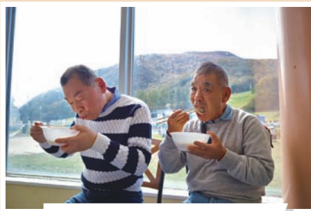
清風園 (10/18) スプリングバレー