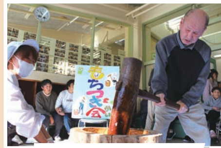
おおぞら学園 (1/19) おおぞら学園内